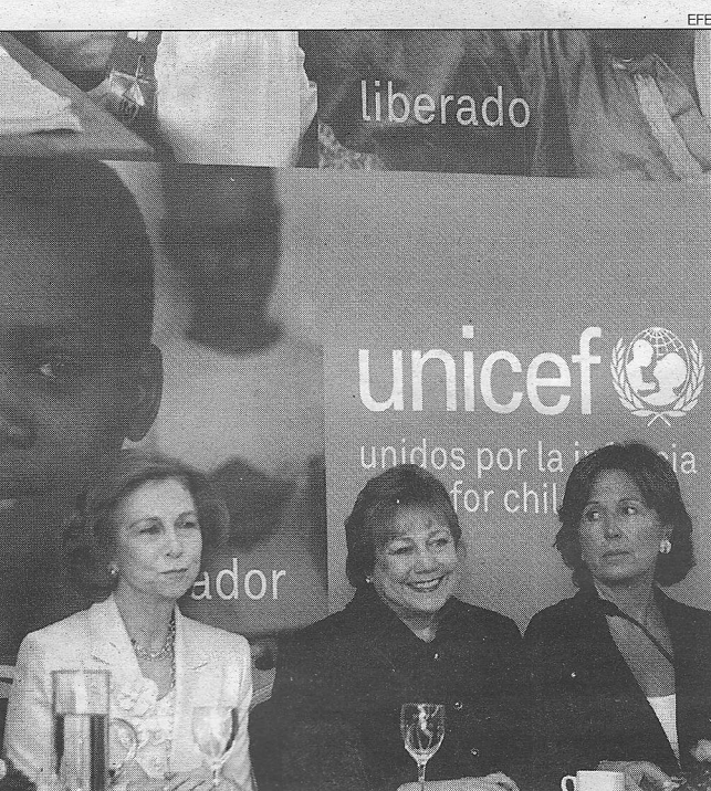
Sofia és presidenta d'honor del comitè espanyol de l'Unicef.